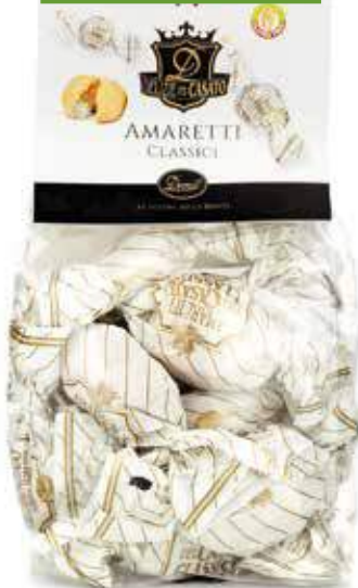
AMARETTI CLASSICI CLASSIC AMARETTI