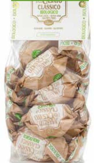
AMARETTI CLASSICI BIO ORGANIC CLASSIC AMARETTI