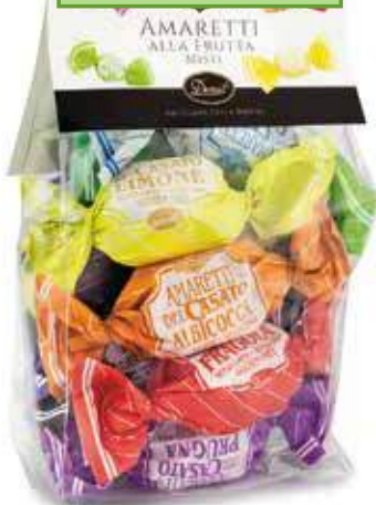
AMARETTI MISTI FRUTTA ASSORTED FRUIT AMARETTI