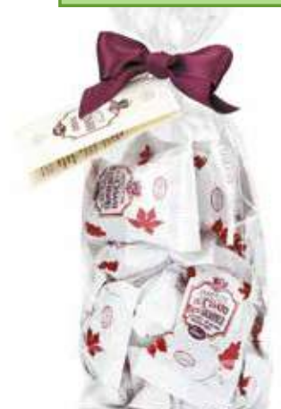
AMARETTINI ALL'ACETO BALSAMICO BALSAMIC VINEGAR AMARETTINI