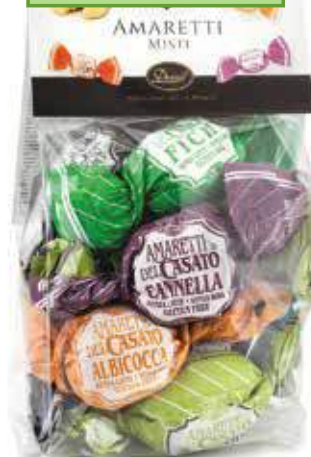
AMARETTI MISTI ASSORTED AMARETTI