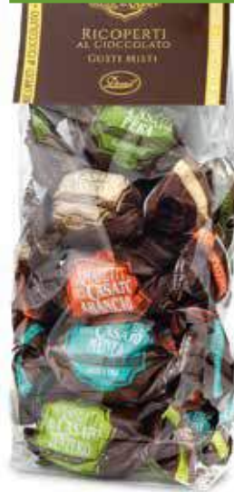
AMARETTI MISTI RICOPERTI AL CIOCCOLATO ASSORTED CHOCOLATE-COVERED AMARETTI